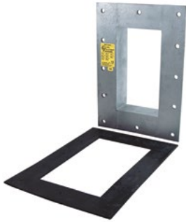
G 6x1 Ex galv EXG006000000115

Cadre G Ex, acier galvanisé, acier doux » G Ex Rahmen, feuerverzinkter Baustahl » Marcos G Ex en acero dulce galvanizado » Рамы G Ex из окрашенной стали