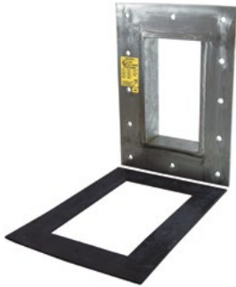
G 6x1 Ex AISI 316 EXG006000000121

Cadre G Ex, acier inox résistant aux acides » G Ex Rahmen, säurefester, rostfreier Edelstahl » Marcos G Ex en acero inoxidable a prueba de ácidos » Рамы G Ex из кислотостойкой нержавеющей стали