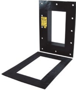
G 6x1 Ex primed EXG006000000112

Cadre G Ex, acier doux peint » G Ex Rahmen, grundierter Baustahl » Marcos G Ex, en acero dulce imprimado » Рамы G Ex из окрашенной стали