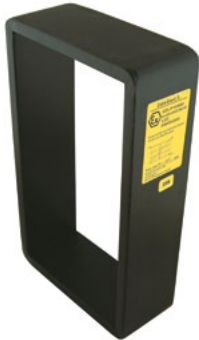
S 6x1 Ex Primed EXS006000000112

Cadres S Ex, acier doux peint » S Ex Rahmen, Baustahl geprimert » Marcos S Ex en acero dulce imprimado » Рамы S Ex из окрашенной стали