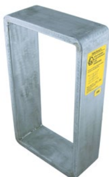
S 6x1 Ex AISI 316 EXS006000000121

Marcos S Ex en acero inoxidable a prueba de ácidos » Рамы S Ex из кислотостойкой нержавеющей стали